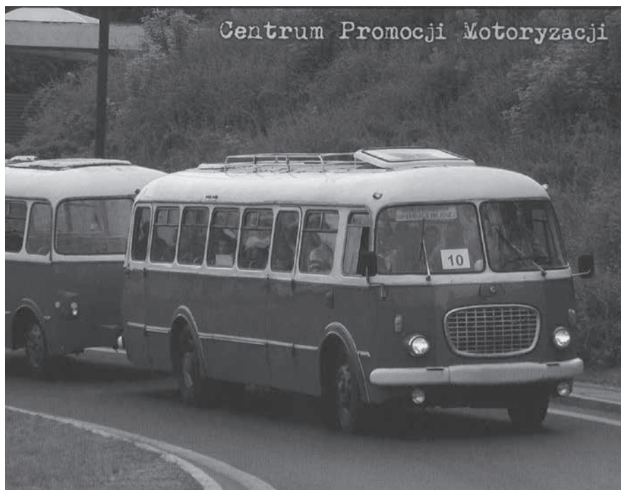
Autobus Jelcz 043

Do napędu pojazdu zastosowano importowany z Czechosłowacji silnik wy-