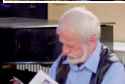
Zdjęcia: Marcin Bulanda