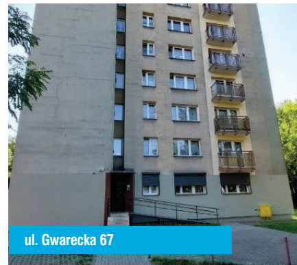
ul. Gwarecka 67

Rada zapoznała się z oceną stanu technicznego zasobów Osiedla „Żołnierzy Września”. Przedstawiona została także