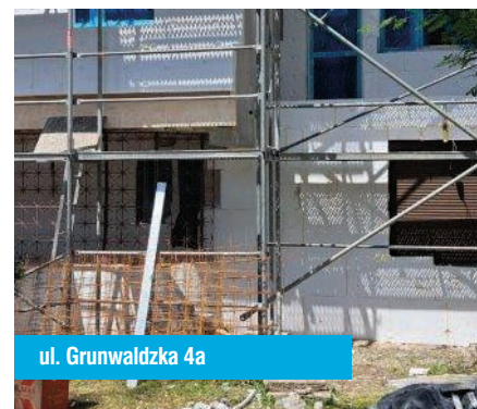
ul. Grunwaldzka 4a

Rada Osiedla zapoznała się z analizą wykorzystania funduszu remontowego w Administracji „Centrum”. Podsumowano przeglądy wiosenne budynków, przedstawiono ocenę sezonu grzewczego oraz omówiono trwające prace remontowe w zasobach Administracji.