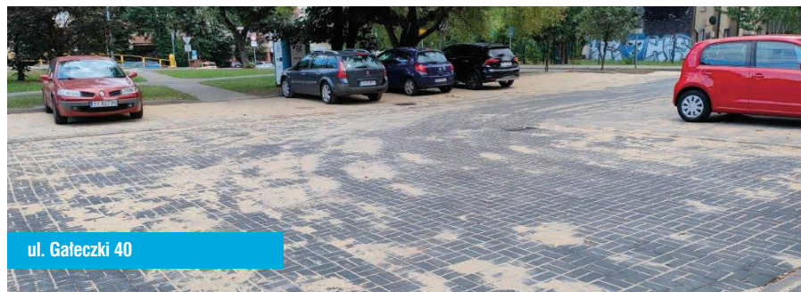
ul. Gałęczki 40