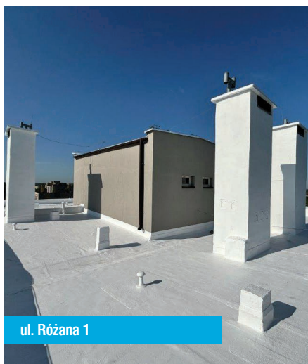
ul. Różana 1

Podczas posiedzeń w czerwcu i lipcu 2024r. Rada Osiedla omówiła przebieg Walnego Zgromadzenia ChSM. Omówiono także sprawy związane z konkursem na najładniejszy balkon i ogródek przydomowy. Dokonano analizy realizacji planu remontów administracji za I półrocze 2024r. Rozpatrywano sprawy bieżące i wniesione przez mieszkańców osiedla.