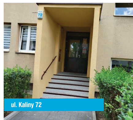
ul. Kaliny 72

towe na terenie Administracji Osiedla „Chorzów Batory”. W lipcu członkowie Rady Osiedla zapoznali się z oceną działalności gospodarczej, realizacją planu remontów za I półrocze 2024r., informacją dotyczącą gospodarki lokalami użytkowymi wraz z analizą opłat oraz omówili problematykę bieżącą.