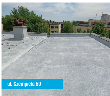
ul. Czempieła 50

Zgodnie z harmonogramem w czerwcu i lipcu 2024r. dokonano rocznych przeglądów instalacji gazowej oraz przewodów kominowych spalinowych i wentylacyjnych. Rozpoczęte zostały prace związane z remontem balkonów przy ul. Zwycięstwa 3a-5a. Kontynuowane są prace związane