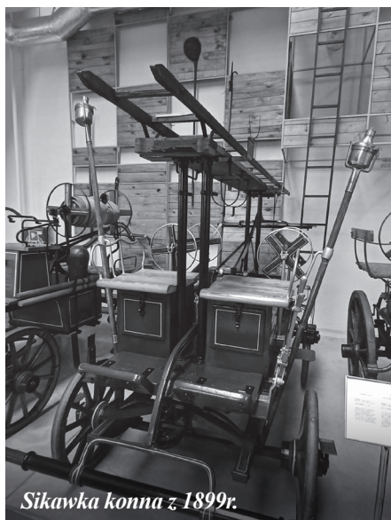
Sikawka konna z 1899r.

1 listopada 1874 roku na terenie ówczesnej Królewskiej Huty powołano do życia Ochotniczą Straż Pożarną, która swą siedzibę miała przy miejskim ratuszu. Służbę pełniło wówczas 38 osób. Wraz z rozwojem miasta liczba strażaków stopniowo wzrastała, osiągając w 1888 roku 250 członków.