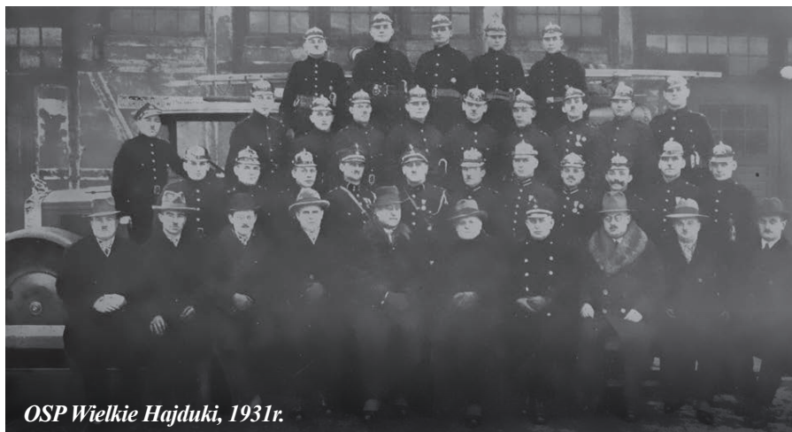
OSP Wielkie Hajduki, 1931r.

W 1934 roku utworzono miasto Chorzów, co nastąpiło po przyłączeniu do miasta Królewska Huta gminy Chorzów (Stary) i Nowe Hajduki. Zreorganizowano również funkcjonujące samodzielnie jednostki strażackie tych gmin, tworząc jedną Miejską Komendę Straży Pożarnej. Remiza w Chorzowie Starym mieście się w dawnym budynku ratusza gminnego przy placu św. Jana (od 1961 roku w budynku tym działa izba wytrzeźwień), natomiast remiza w dawnej gminie Nowe Hajduki mieściła się przy ul. Wolskiego. Również w przyłączonej do miasta w 1939 roku gminie Wielkie Hajduki funkcjonowała straż pożarna, a jej siedziba mieściła się przy ulicy Wrocławskiej. Należy wspomnieć, że na terenach zakładów przemysłowych funkcjonowały zakładowe straże pożarne. Były więc straże kopalniane (ich pozostałością jest budynek remizy na terenie Kompleksu „Sztymbark” nieopodal szybu „Prezydent”) oraz hutnicze (remiza huty „Batory” mieściła się przy ul. Racjonalizatorów). Własną straż miały również: Elektrownia Chorzów, Zakłady Azotowe, Zakłady Chemiczne „Hajduki” (dawne zakłady Rütgersa).