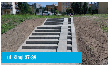
ul. Kingi 37-39

W czerwcu i lipcu 2024r. zakończono prace związane z remontem dachu przy ul. Lompy 12, remontem chodnika i schodów terenowych przy ul. Rodziny Oswaldów 18, remontem węzła centralnego ogrzewania przy ul. Węglowej 5, wymianą pionu centralnego ogrzewania wraz z grzejnikami na klatkach schodowych przy ul. Filarowej 4,6, ul. Kingi 39-49, remontem schodów wejściowych do budynku przy ul. Gwareckiej 37-43, malowaniem klatek schodowych przy ul. Łągiewnickiej 104-112, dociepleniem dylatacji po-