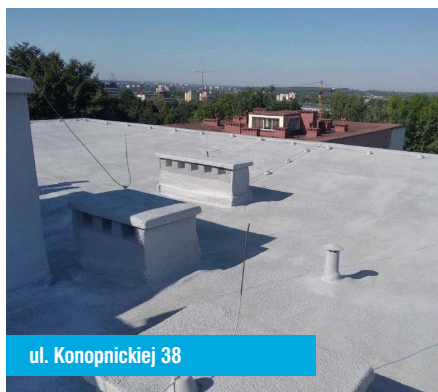
ul. Konopnickiej 38