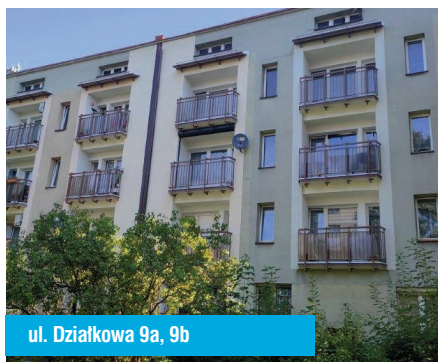
ul. Działkowa 9a, 9b